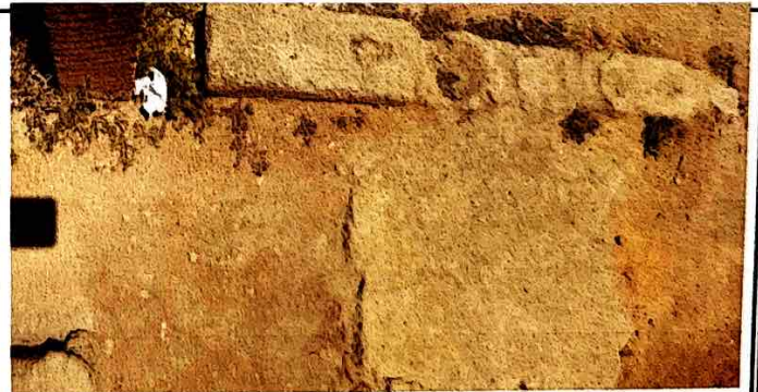
Foto 6: Reparación de entortado por deterioro, frente a la Dirección.

Observación: Si es necesario se pueden agregar hojas adicionales y actualizar el número de hojas.