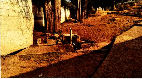
Foto 1: Sustrucción de Pileta para lavar trapeadores, por deterioro.