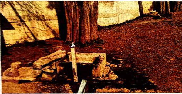
Foto 3: Sustrucción de Pileta para lavar trapeadores, por deterioro.