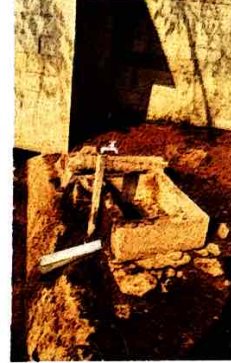
Foto 2: Sustrucción de Pileta para lavar trapeadores, por deterioro.