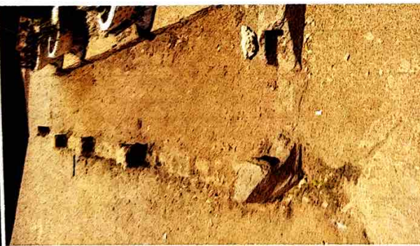
Reparación de entortado por deterioro, frente a la Dirección.